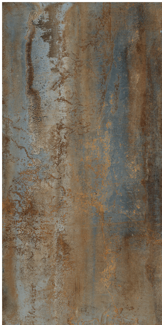
BEAT (CUIVRE) fini mat

59.6 x 119.5 cm (24" x 48") BC.BD.FIR.2448