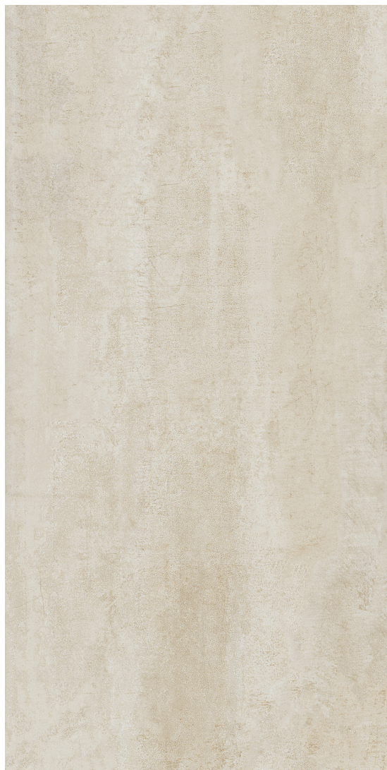
DYNAMIC (BEIGE) fini mat

59.6 x 119.5 cm (24" x 48") BC.BD.DYN.2448