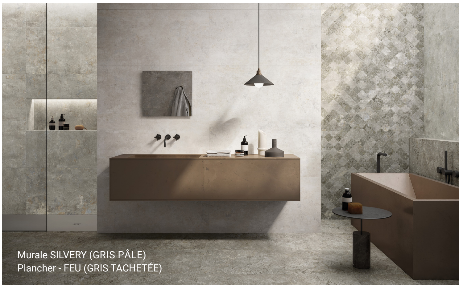
Murale SILVERY (GRIS PÂLE) Plancher - FEU (GRIS TACHETÉE)