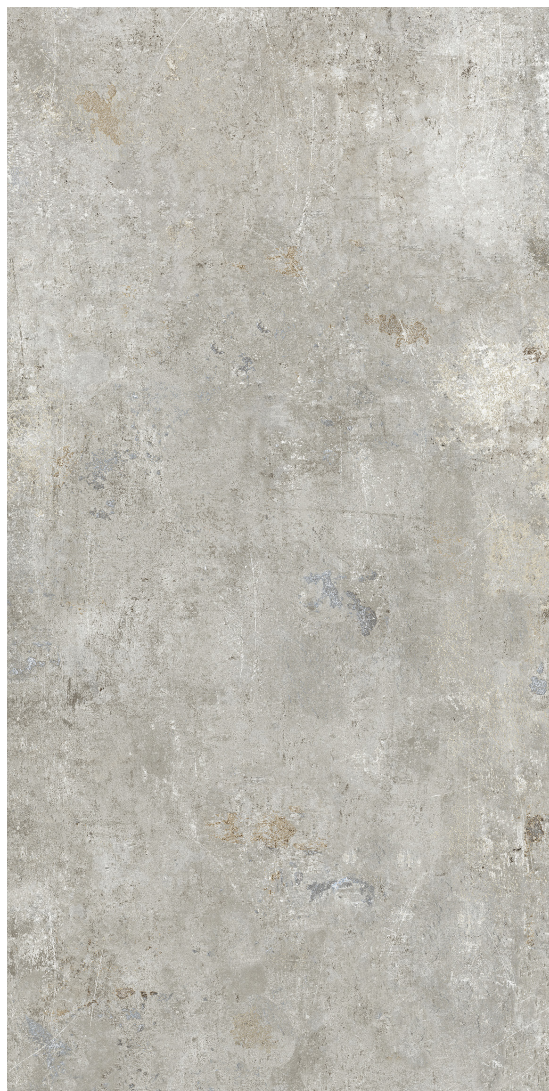
FEU (GRIS TACHETÉE) fini mat

59.6 x 119.5 cm (24" x 48") BC.BD.FIR.2448