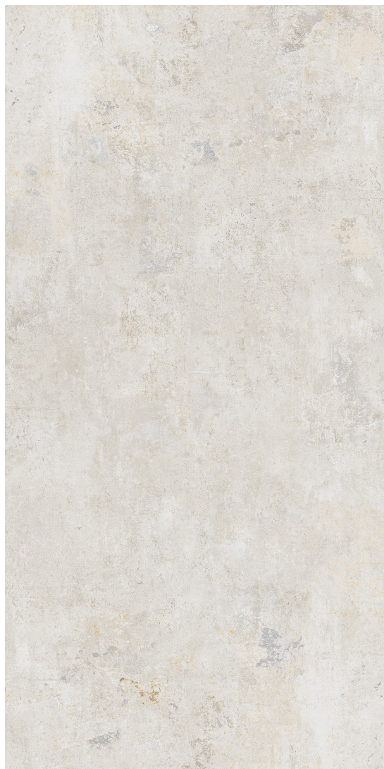
SILVERY (GRIS PÂLE) fini mat

59.6 x 119.5 cm (24" x 48") BC.BD.DYN.2448